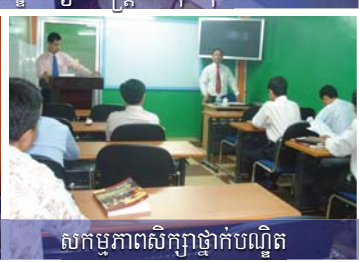
សកម្មភាពសិក្សាថ្នាក់បណ្ឌិត