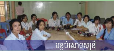
បន្ទប់សោទស្សន៍

បណ្ណាល័យមានឯកសារសម្បូរបែប និងមានកុំព្យូទ័រគ្រប់គ្រាន់ភ្ជាប់ដោយប្រព័ន្ធអ៊ីនធឺណិតដោយឥតគិតថ្លៃ