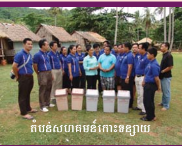
តំបន់សហគមន៍កោះទន្សាយ