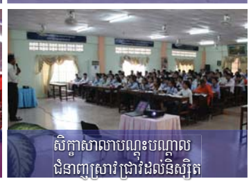
សិក្ខាសាលាបណ្តុះបណ្តាល ជំនាញស្រាវជ្រាវដល់និស្សិត