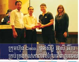
ក្រុមហ៊ុន Cisco ផ្តល់សិទ្ធិ អាស៊ី អឺរ៉ុប គ្រប់គ្រងគុណភាពអប់រំប្រចាំប្រទេស