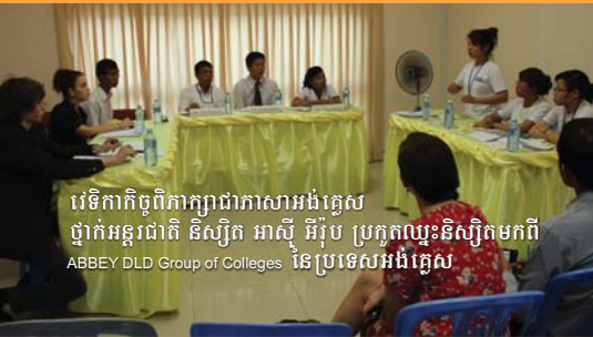
វេទិកាភិក្ខុពិភាក្សាជាភាសាអង់គ្លេស ថ្នាក់អន្តរជាតិ និស្សិត អាស៊ី អឺរ៉ុប ប្រកួតប្រជែងនិស្សិតមកពី ABBEY DLD Group of Colleges នៃប្រទេសអង់គ្លេស