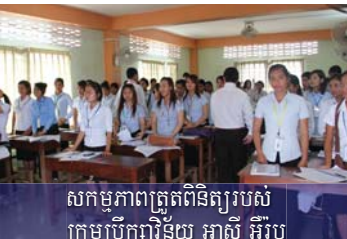
សកម្មភាពព្រឹត្តិការណ៍ពិនិត្យរបស់ ក្រុមប្រឹក្សាវិន័យ អាស៊ី អឺរ៉ុប