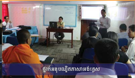
ថ្នាក់អនុបណ្ឌិតភាសាអង់គ្លេស