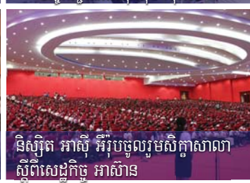
និស្សិត អាស៊ី អឺរ៉ុបចូលរួមសិក្ខាសាលា ស្តីពីសេដ្ឋកិច្ច អាស៊ាន