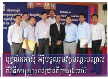
បុគ្គលិកអាស៊ី អឺរ៉ុបចូលរួមវគ្គបណ្តុះបណ្តាល វិទ្យាសាស្ត្រស្រាវជ្រាវពិស្តារសង្គម