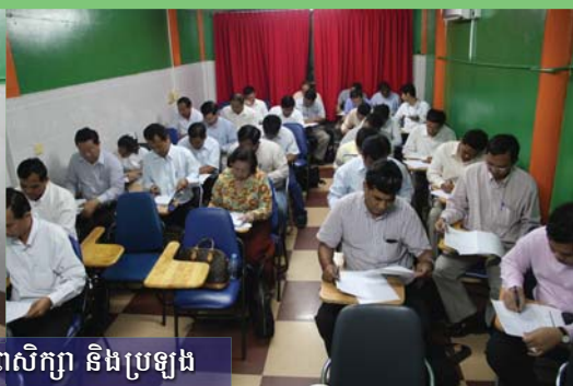
សកម្មភាពសិក្សា និងប្រឡង

សិក្សាជាមួយសាស្ត្រាចារ្យបណ្ឌិត អនុបណ្ឌិតដែលមានបទពិសោធន៍ (សូមអានទំព័រចុងក្រោយ)