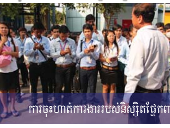
ការចុះហាត់ការងាររបស់និស្សិតផ្នែកពាណិជ្ជកម្ម និងទេសចរណ៍ដល់ទឹកដីកម្ពុជា