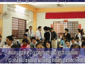
គណៈប្រតិភូវិទ្យាស្ថានខុងជឺ ប្រទេសចិន ជួបសំណេះសំណាល់និស្សិតសិក្សាភាសាចិននៅ អាស៊ី អឺរ៉ុប