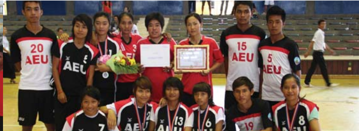
ក្រុមកីឡារបស់អាស៊ី អឺរ៉ុប ទទួលបានមេដាយជាច្រើនក្នុងក្របខណ្ឌកីឡាថ្នាក់ឧត្តមសិក្សាទូទាំងប្រទេស