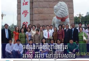
ទស្សនកិច្ចសិក្សានិស្សិត អាស៊ី អឺរ៉ុប នៅប្រទេសចិន 03/03/2