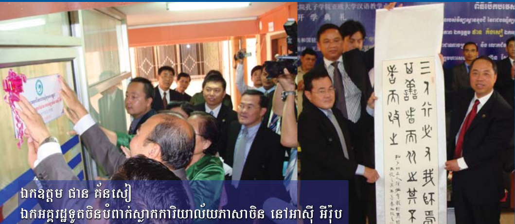
ឯកឧត្តម ជាន គំនសៀ ឯកអគ្គរដ្ឋទូតចិនបំបាក់ស្លាការិយាល័យភាសាចិន នៅអាស៊ី អឺរ៉ុប

为了培养能熟练运用汉语，具备扎实的汉语基础知识和一定的专业理论与基本的中国人文知识，熟悉中国国情和文化背景的适应现代国际社会需求的全面发展的应用汉语人才，柬埔寨王家研究院孔子学院和亚欧大学合作设立汉语本科专业。专业学制4年。全部课程均由中国籍专业教师任教。优秀学生可获得由中国国家汉办提供的奖学金赴中国学习。毕业后可获得由柬埔寨教育部颁发正规本科文凭。欢迎广大有志于从事汉语教学、翻译及其他相关事业的学生报名！