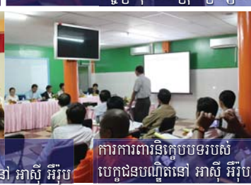
ការការពារនិក្ខេបបទរបស់ បេក្ខជនបណ្ឌិតនៅ អាស៊ី អឺរ៉ុប