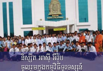
និស្សិត អាស៊ី អឺរ៉ុប ចូលរួមក្នុងកម្មវិធីទូរទស្សន៍