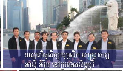
ទស្សនកិច្ចសិក្សាបច្ចុប្បន្ន វិទ្យាស្ថានហ្វូ អាស៊ី អឺរ៉ុប នៅប្រទេសសិង្ហបុរី