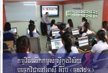
កម្មវិធីលើកកម្ពស់ស្ត្រីក្នុងវិស័យ បច្ចេកវិទ្យាទៅអាស៊ី អឺរ៉ុប (ចុះ៧៥%)