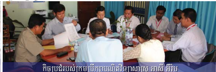
កិច្ចប្រជុំរបស់ក្រុមប្រឹក្សាបណ្ឌិតវិទ្យាសាស្ត្រ អាស៊ី អឺរ៉ុប