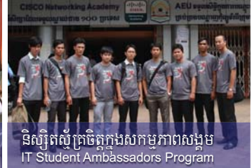
និស្សិតស្ម័គ្រចិត្តក្នុងសកម្មភាពសង្គម IT Student Ambassadors Program