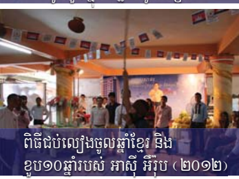
ពិធីដំបូងរៀនចូលស្នាក់ខ្មែរ និង ខ្មែរ១០ឆ្នាំរបស់ អាស៊ី អឺរ៉ុប (២០១២)