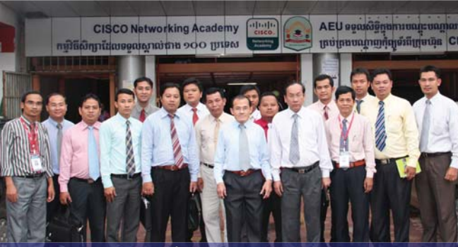
គណៈកម្មាធិការទទួលស្គាល់គុណភាពអប់រំ ចុះពិនិត្យសាកលវិទ្យាល័យ អាស៊ី អឺរ៉ុប