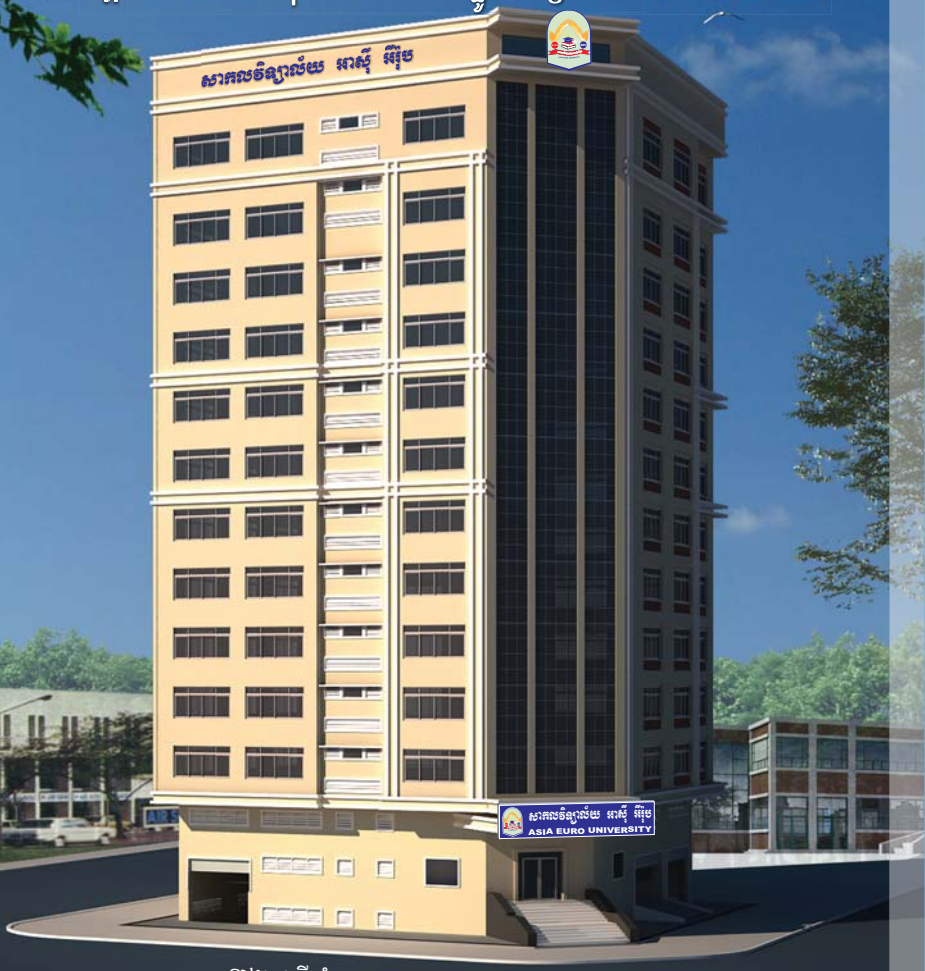
ខាងត្បូងទីតាំងបច្ចុប្បន្នឆ្ងាយ ៨០ម៉ែត្រ