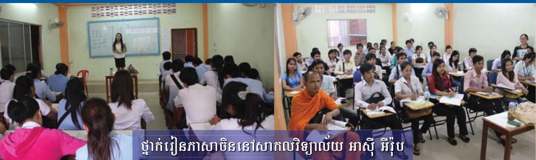
ថ្នាក់រៀនភាសាចិននៅសាកលវិទ្យាល័យ អាស៊ី អឺរ៉ុប