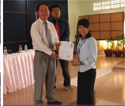
ពិធីផែនការបណ្តុះបណ្តាលសេរីដល់ និស្សិតពូកែ និងប្រធានថ្នាក់